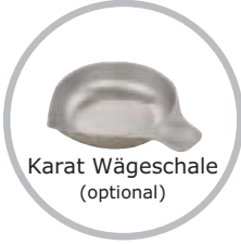
Karat Wägeschale (optional)