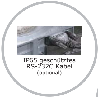
IP65 geschütztes RS-232C Kabel (optional)