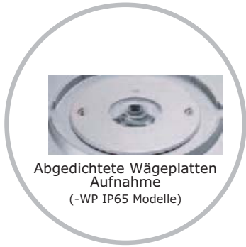
Abgedichtete Wägeplatten Aufnahme (-WP IP65 Modelle)