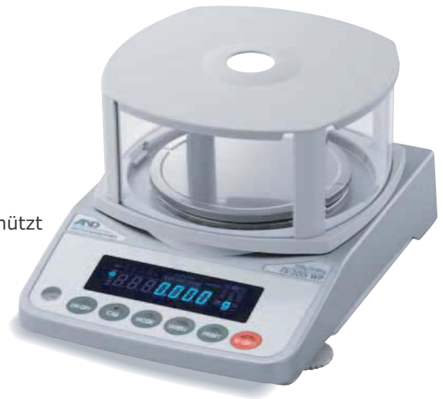
FX-300iWP mit Standardwindschutz

FZ-i und FZ-i-WP: interne Kalibrierung FX-i und FX-i-WP: externe Kalibrierung FZ-i-WP und FX-i-WP: IP65 Staub & Wasser geschützt