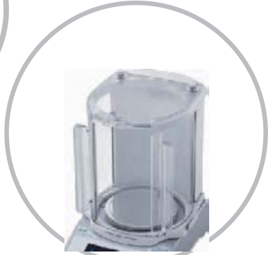
Großer Windschutz (optional)