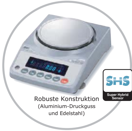
Robuste Konstruktion (Aluminium-Druckguss und Edelstahl)